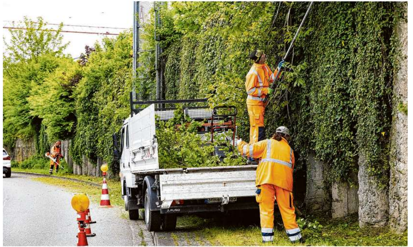
Mitarbeiter des Werkhofs sorgen im Hirschgraben dafür, dass der Bewuchs entlang der Straße nicht überhand nimmt. Auch das ist eine städtische Aufgabe, die der Eigenbetrieb übernimmt.

Nun wundern sich zumindest die Fraktionen von FWV und Bündnis 90/Die Grünen, dass bis heute wenig passiert ist und die Verwaltung jetzt eine externe Beratungsfirma (erwartete Kosten: 100.000 Euro) einsetzen will, um den Prozess in Gang zu bringen. „Der Antrag“, heißt es in einer